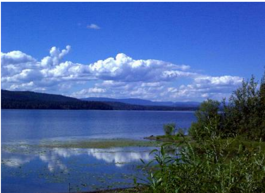
Blick von unserem Stellplatz auf den McLeods Lake

Beim Öffnen der Vorhänge konnte man aus dem Heckfenster des Motorhomes wieder etwas sehen. Die Bäume waren von Wolken umgeben als hätte man auf den Baumspitzen Watte verteilt.