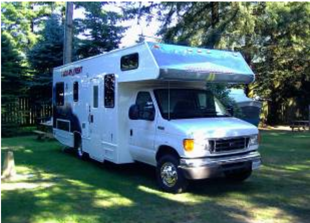
Unser Motorhome auf dem Stellplatz in HOPE