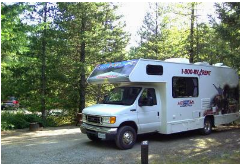
Stellplatz im Brandywine Fall Provincial Park

gefeuert was das Holz hergab. Wegen des Hinweises, dass das Feuer vor dem zu Bett gehen total gelöscht werden muss, wurden 9,5 Liter „Löschwasser“ im Kanister geholt. Diese löschten gegen halb zwölf das brennende Feuer. Mit der Genugtuung doch noch ein Feuer gehabt zu haben, übermannte uns der Schlaf.