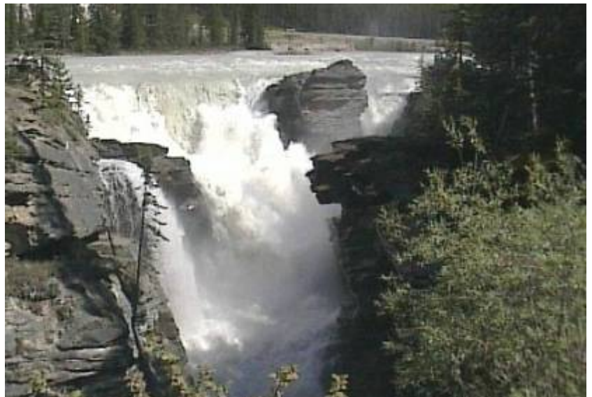
Blick auf die Athabasco Falls

Dann erreichten wir Jasper. Genau wie 2002 waren die Campgrounds overflowed (voll belegt). Also hieß es einen Ausweichplatz suchen. Mit dem Snaring Overflow Campground war er schnell festgelegt. Vor der Fahrt dorthin wurden die