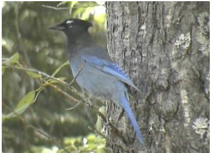
Der Stellers Jay

Kurz nach unserer Abfahrt entpuppte sich ein „zerfetzter“ LKW Reifen am Straßenrand als toter Schwarzbär, der in der Nacht angefahren worden sein musste. Zum Filmen und Fotografieren blieb keine Zeit, denn wegen Autos hinter uns konnten wir nicht stehen bleiben. Entlang des Pine Rivers ging es bis auf 935 m zum Pine Pass hinauf. Hier belohnte uns ein toller Ausblick über den Azouzetta Lake. Auf der Weiterfahrt sind wir 2 km über das