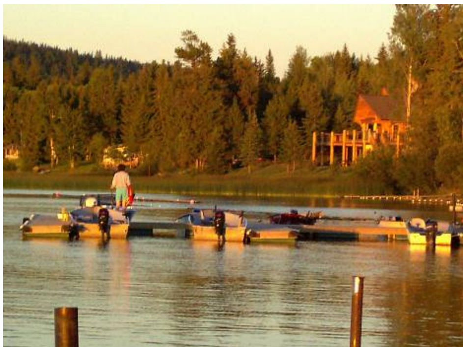
Abendstimmung am Horse Lake

Von unserem leicht erhöhten Platz konnte man eine Entenfamilie beim nächtlichen Ausflug beobachten. Das Geschrei der Loons schallte über den See. Bald stimmten auch die Kojoten ihren „Gesang“ an und verständigten sich am gesamten gegenüberliegenden Ufer. Ein mit funkelnden Sternen übersäter klarer Nachthimmel hätte noch lange mit dem hintergründigen Geheule der Kojoten genossen werden können. Doch die immer schneller sinkende Temperatur und die ständig steigende