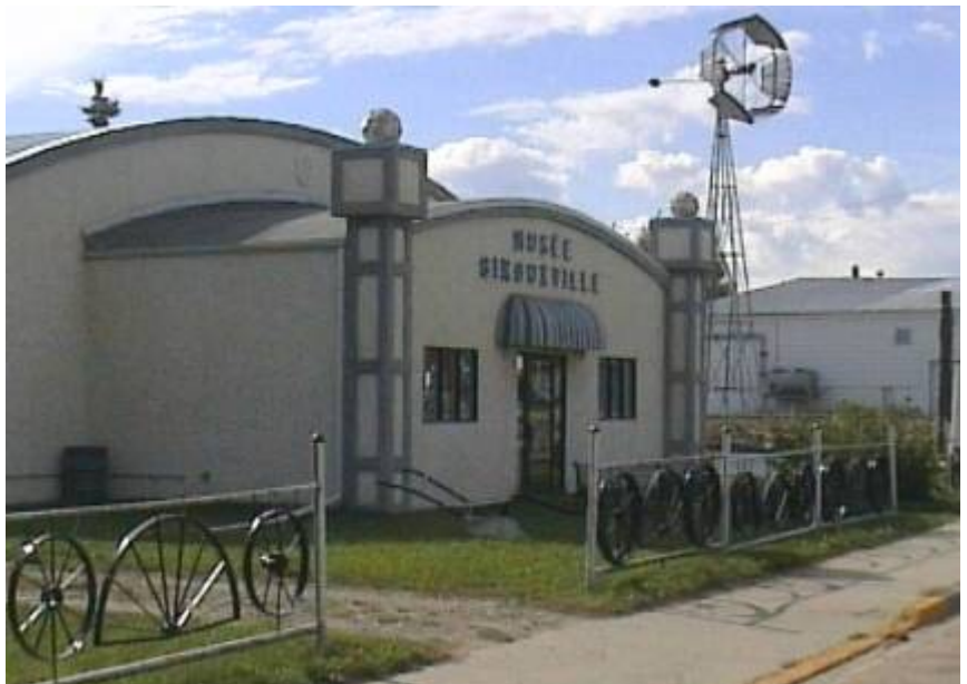
Das Museum von Girouxville

Der geplante Aufenthaltsort Rycroft war obwohl wunderschön gelegen schnell verworfen, denn vor Ort waren schon mittags so viele Schnaken, dass es abends sicherlich unerträglich gewesen wäre. Aber eine Kaffeepause wurde hier