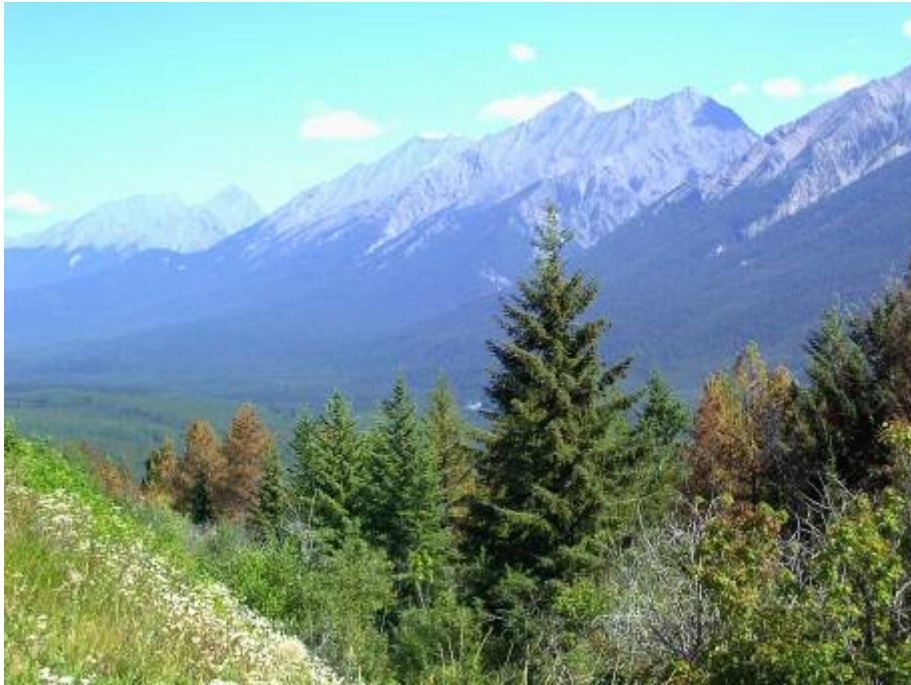
Im Kootenay Valley