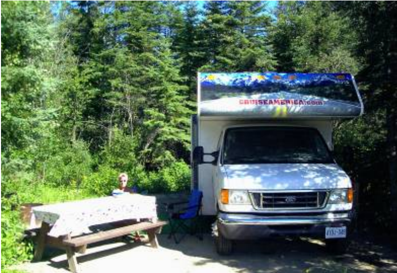
Standplatz in Whitecourt

Heute war Ausschlafen angesagt. Bei wolkenlosem Himmel wurde in Freien gefrühstückt. Wegen der niedrigen Temperaturen in der Nacht mit Fleecepulli und in langen Hosen. Die Innentemperatur im Mobil betrug beim Aufstehen 10° C.