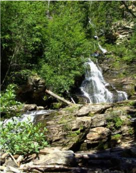
Blick auf die Bijou Falls

Wieder war für diesen Tag eine kurze Strecke angesagt. Deshalb konnte länger geschlafen werden. Dennoch trieb es Anita vor dem Waschen und Frühstück zum Telefon. Grund war es durch frühes Telefonieren Dollars zu sparen. Telefonate mit Sandra und ihren Eltern waren angesagt.