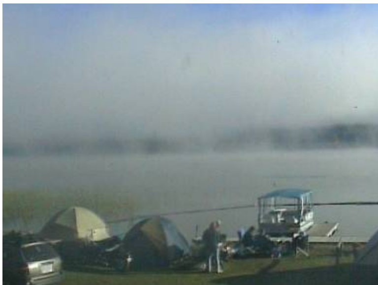
Morgennebel am Horse Lake

Langes Ausschlafen war bei zwei Tagen Aufenthalt selbstverständlich. Als wir gegen 9:00 Uhr aufstanden, vertrieb die Sonne so langsam die Nebelschwaden die wie ein Bettuch über dem See lagen.