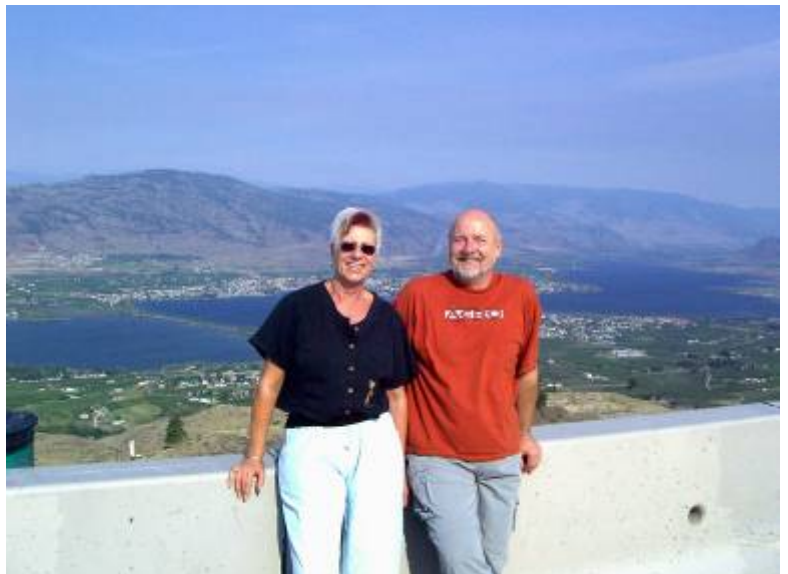
Auf einer „rest area“ über dem Osoyoos Lake

In Castlegar wurde bei herrlichem Ausblick, aber sehr dunstigem Wetter, auf einer Rest Area am Highway 3 Mittagspause gemacht. Salat mit Fisch gab es zum Mittagessen.