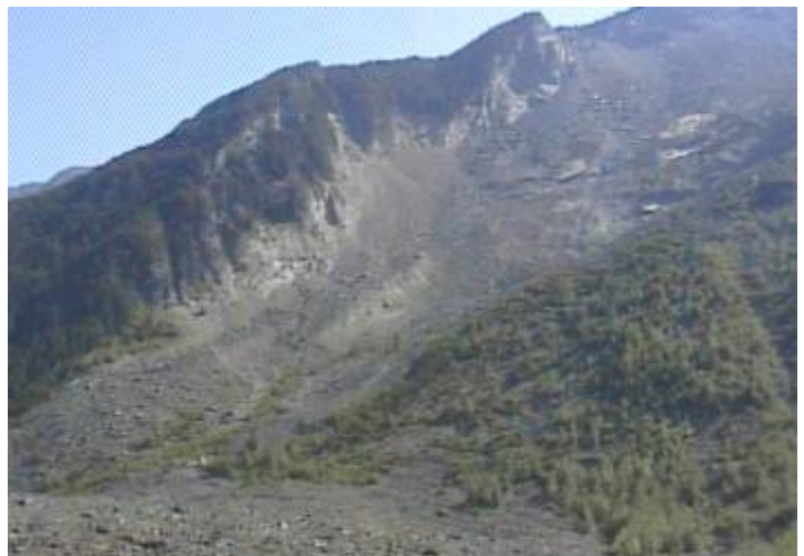
Der „Hope Slide“

Ebenso früh wie wir aufgestanden waren ging es weiter Richtung Osoyoos. Vorbei an dem HOPE SLIDE (Erdrutsch 1965) ging es über den Allison Pass (1352 m) durch den Manning Park auf dem Highway 3 am Similkaween River entlang nach Princeton. Bei Overwaities wurden Lebensmittel eingekauft. Ein kleiner Bummel durch die Westernstadt führte uns in ein Paradies. Hier konnten Dinge gekauft werden die schon „gierig“ gesucht wurden. Klammern, Wäscheleine und Pfannen. Eine Cap mit Kanadaaufschrift wurde zu einem günstigen Preis auch gefunden. Anschließend wurden