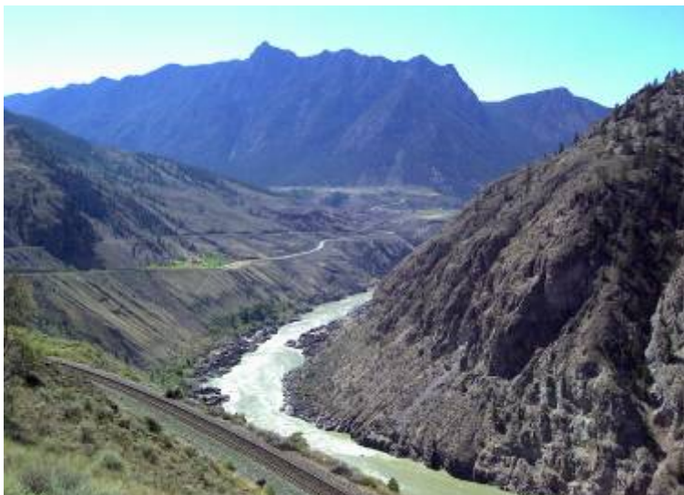
Kurz vor Lilloet – Blick auf den Fraser River

Gegen 18:00, die Temperatur war auf inzwischen 30° C gesunken, ging es zum Office um die zu Hause aufgelaufenen eMails abzufragen. Das Tempo de Seitenaufbaus war extrem langsam. So wurden nicht alle gelesen, aber doch schon einige gelöscht. Anita grüßte die