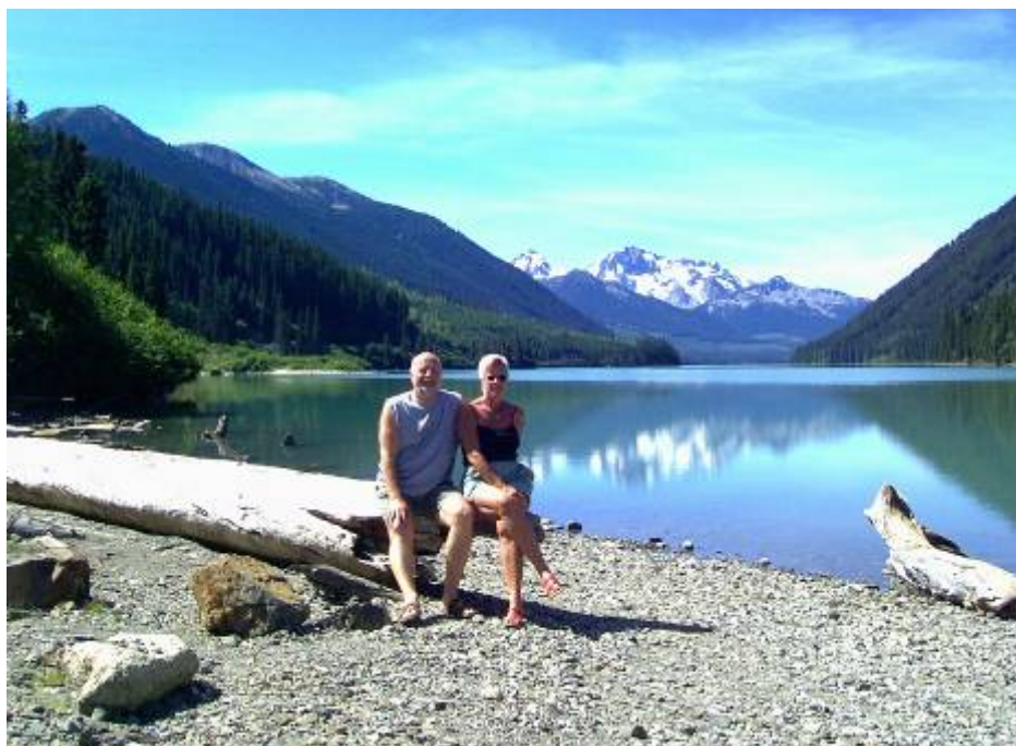
Stop am Duffey Lake

Jetzt wurde das Teilstück nach Whistler (Austragungsort der Skiwettkämpfe der Olympischen Winterspiele 2010) in Angriff genommen. Den Mount Brew (2386 m) ließen wir links von uns liegen