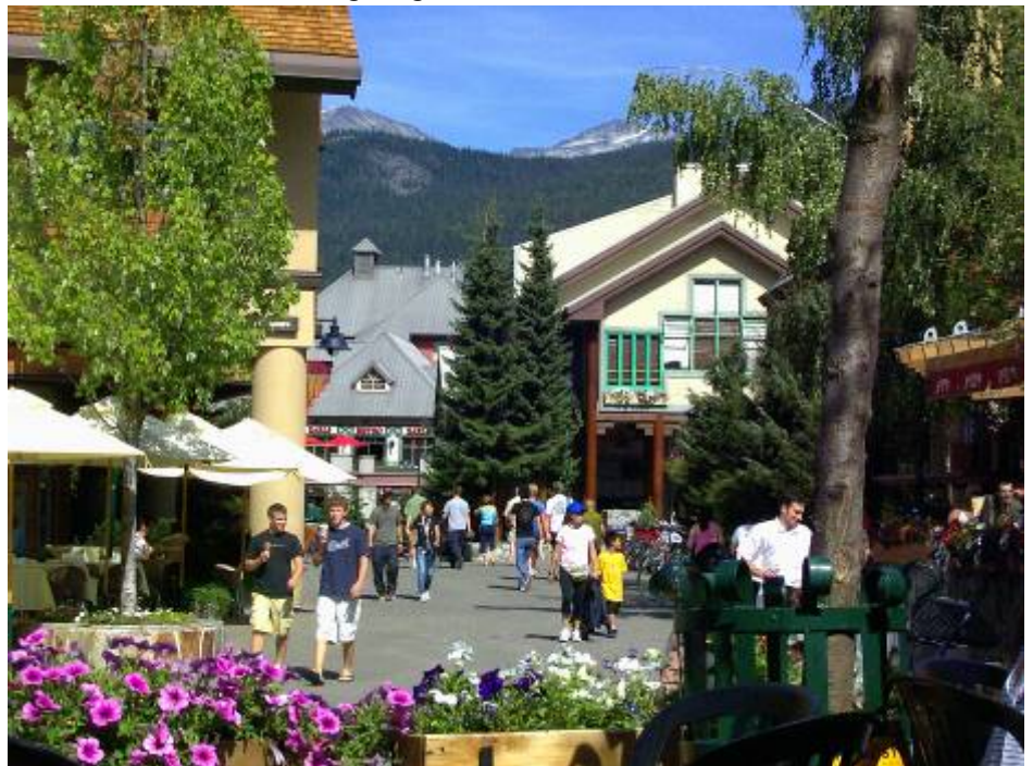
Touristentrubel in Whistler